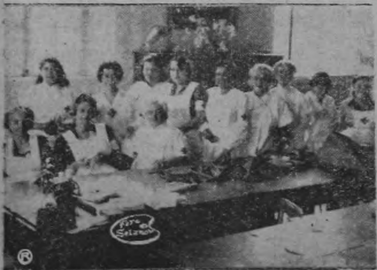
DAMAS BLANCAS. —Durante el tiempo en que se desarrollaron todas las actividades bélicas las Damas Blancas prestaron continuos servicios en favor de los heridos. En la foto aparecen en el salón de Costura.

—Viene de la Página PRIMERA— solicitado consignar, para que conste, el propio Ministro Volio Sancho.