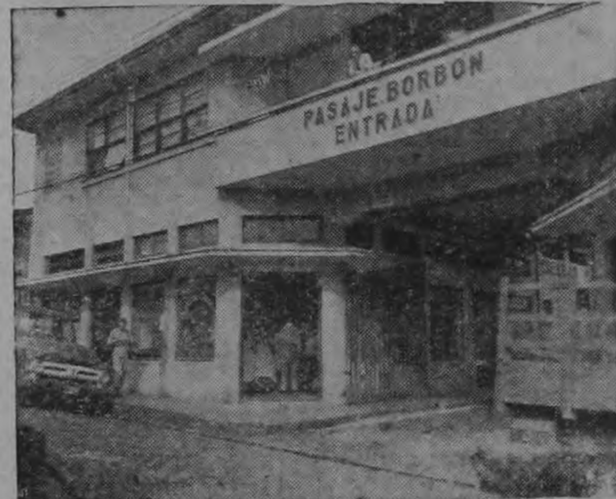
ESTANCO N° 8, situado en la entrada del Pasaje Borbón, en Calle 10.