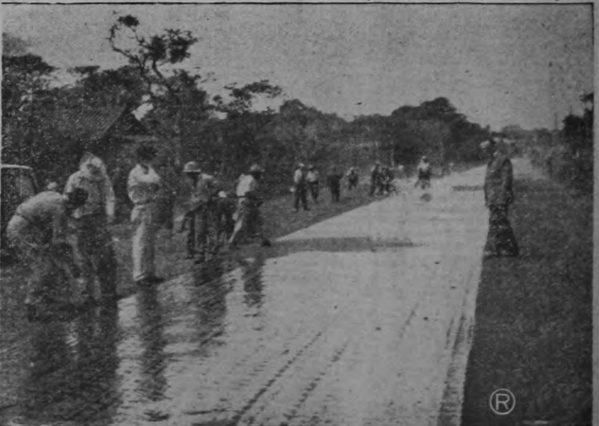
El Ministro Orlich y el ingeniero Sánchez observan el excelente trabajo que se lleva a cabo en la carretera interamericana, en la sección de La Uruca. No se están haciendo remiendos parciales, sino que, teniendo en cuenta el intenso movimiento de esa vía, toda la carretera se está recubriendo de una capa completa de asfalto.