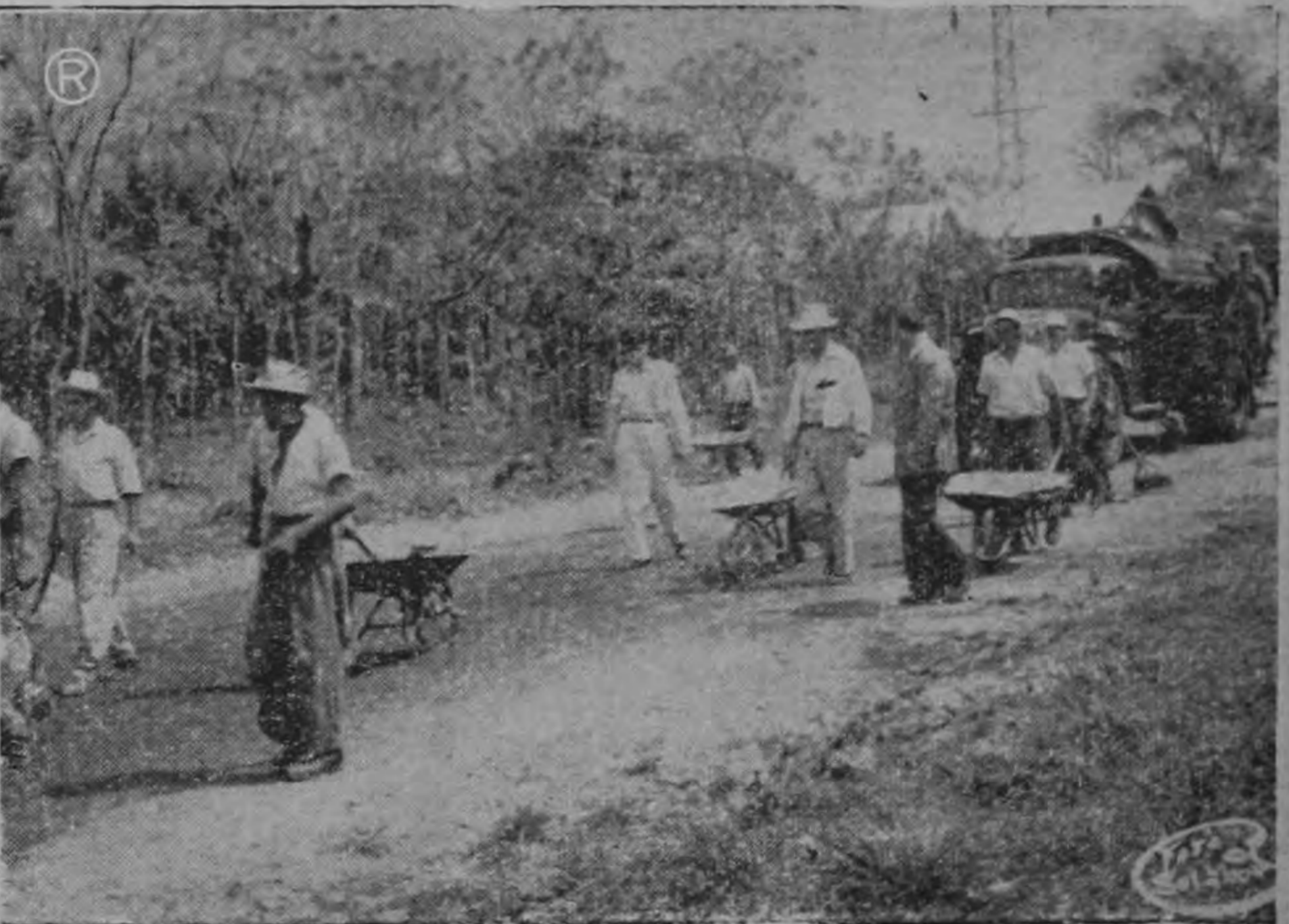
Las modernas maquinarias que se utilizan en las obras, y el personal de trabajadores que conducen las carretillas con la mezcla asfáltica, laboran a ritmo intenso ante la mirada vigilante del Ministro de Obras Públicas, don Francisco J. Orlich y los ingenieros que lo acompañaron en su recorrido de inspección de ayer en el sector de La Uruca y El Coco.