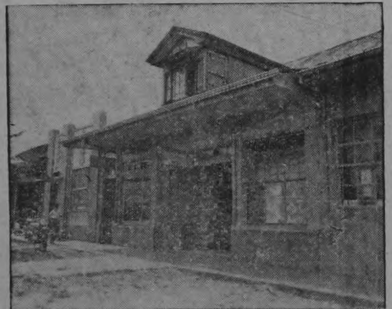
ESTANCO N° 16, situado en Barrio México — Calle 8.